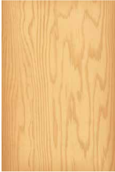
松 板目ランダム Emma-GK-02 2