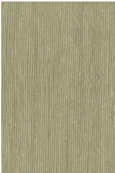
グリーンアプリコット 柀目ランダム Emma-RC-08 3