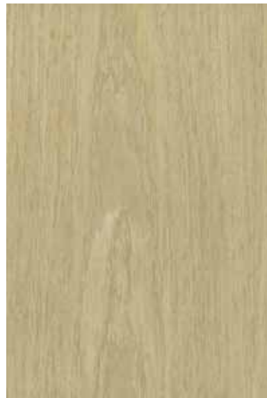
シオジ 柀目ランダム Emma-RC-11 4

※ Emmaは天然木を使用した商品です。サンプルと実際の商品とは、木目柄、色味、濃淡、節等の入り方が異なります。