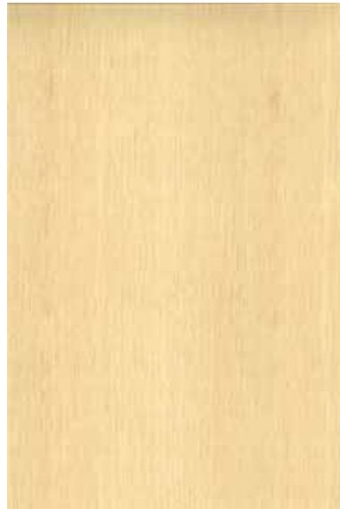
ホワイトアッシュ 柾目ランダム Emma-GK-07 2