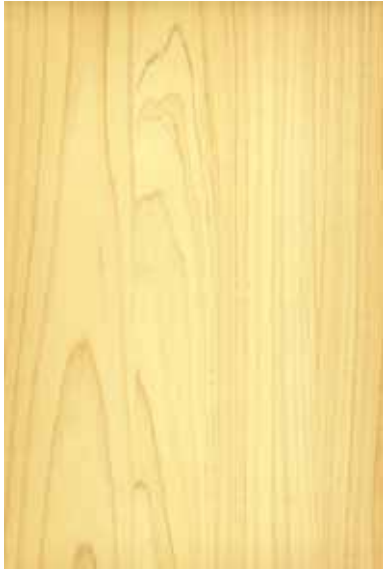
【天竜】 桧 板目パターン ※ 受注生産品