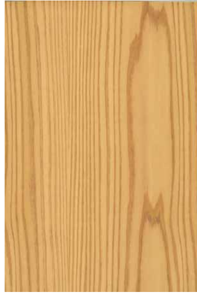
【天竜】 杉赤身 板目パターン ※ 受注生産品