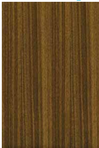
チーク 柀目ランダム Emma-GK-19 4