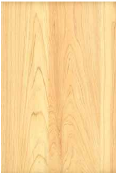
【みよし】 桧 板目ランダム Emma-WS-03 2