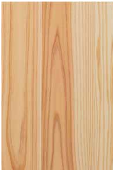
【大和】 杉源平 板目ランダム Emma-WS-06W Y1