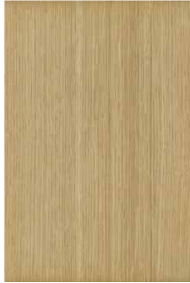
オーク 柾目ランダム Emma-GK-04 2