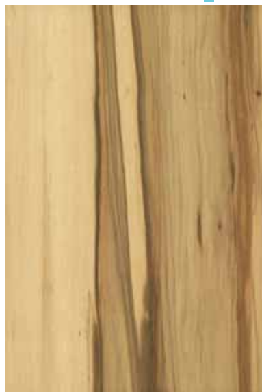
レッドガム 板柀ランダム Emma-GK-20 4