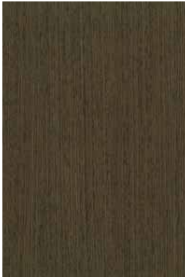
ヴァインゲ 柀目ランダム Emma-RC-05 3