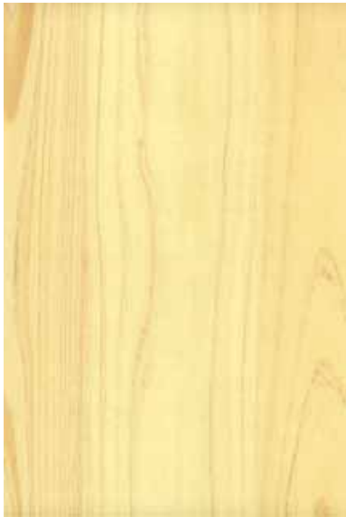
【東京の木】 桧 板目ランダム ※ 受注生産品