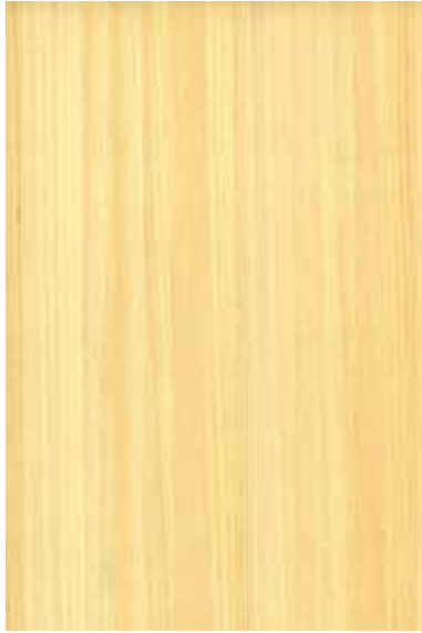
【天竜】 桧 柀目ランダム ※ 受注生産品