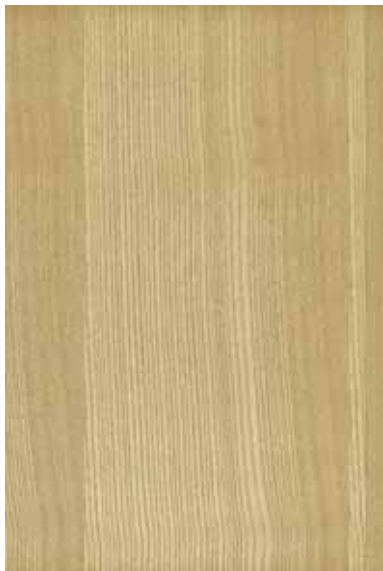
タモ 柀目ランダム Emma-GK-013 3