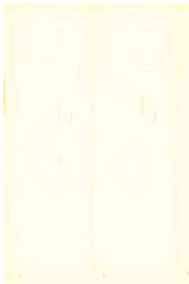
シカモア 柀目ランダム Emma-GK-21 5

※ Emmaは天然木を使用した商品です。サンプルと実際の商品とは、木目柄、色味、濃淡、節等の入り方が異なります。