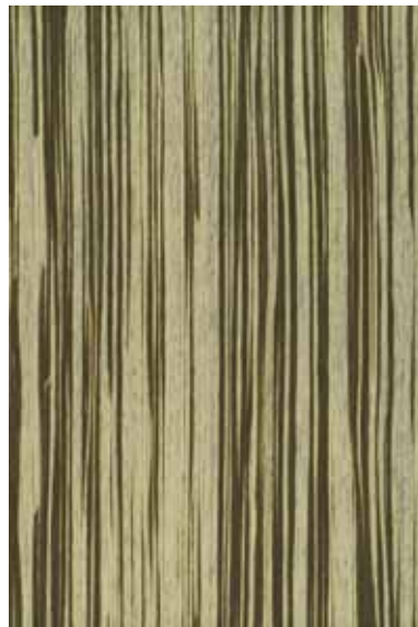
ホワイトゼブラウット 柀目ランダム Emma-RC-10 3