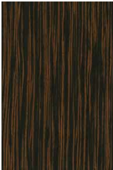
ブラウンエボニー 柀目ランダム Emma-RC-09 3