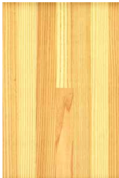
【天竜】 杉 集成材 ランダム ※ 受注生産品