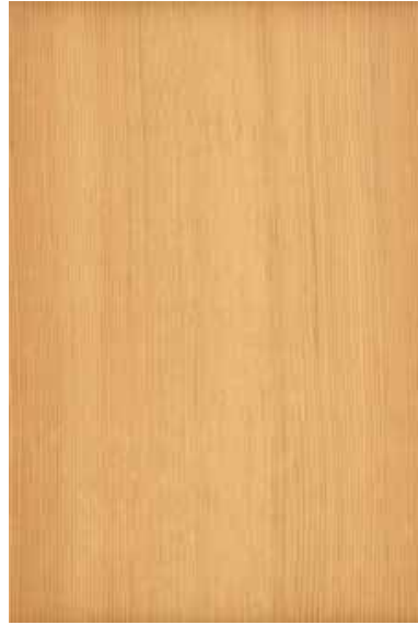
松 柾目ランダム Emma-GK-03 2