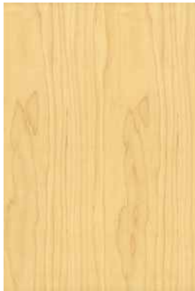
ハードメープル 板目ランダム Emma-GK-14 3