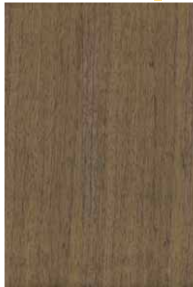
ウォルナット 柾目ランダム Emma-GK-12 3

※ Emmaは天然木を使用した商品です。サンプルと実際の商品とは、木目柄、色味、濃淡、節等の入り方が異なります。