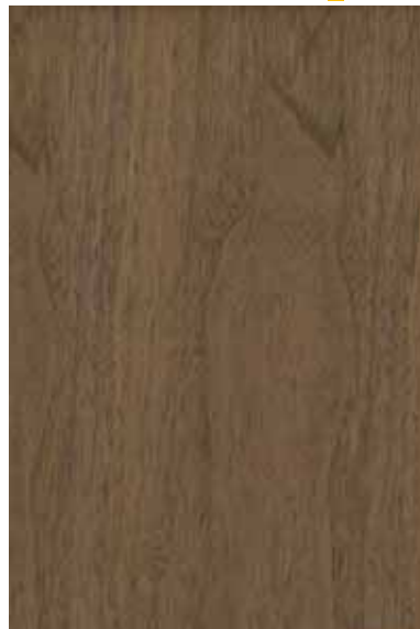
ウォルナット 板目ランダム Emma-GK-11 3