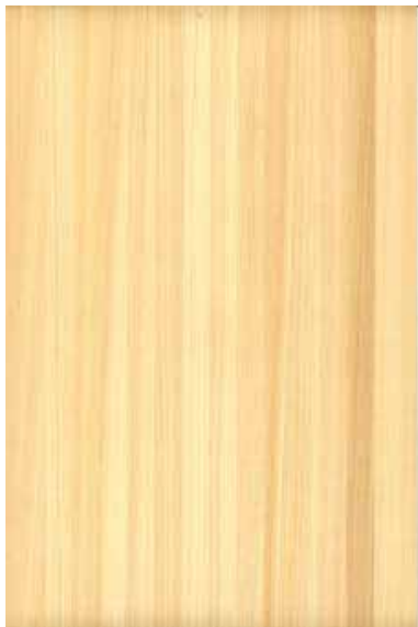
【みよし】 桧 柀目ランダム Emma-WS-04 2