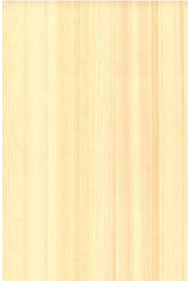
【大和】 桧 柀目ランダム Emma-WS-02 Y2