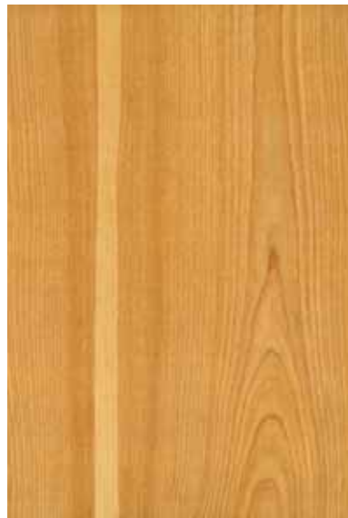
アメリカンチェリー 板目ランダム Emma-GK-15 3