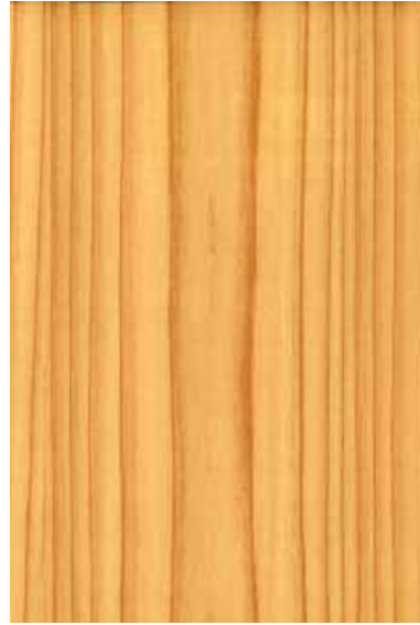
【大和】 杉赤身 板目パターン Emma-WS-05W Y3