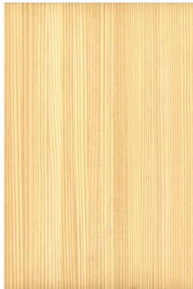
【みよし】 杉 柀目ランダム Emma-WS-07 1