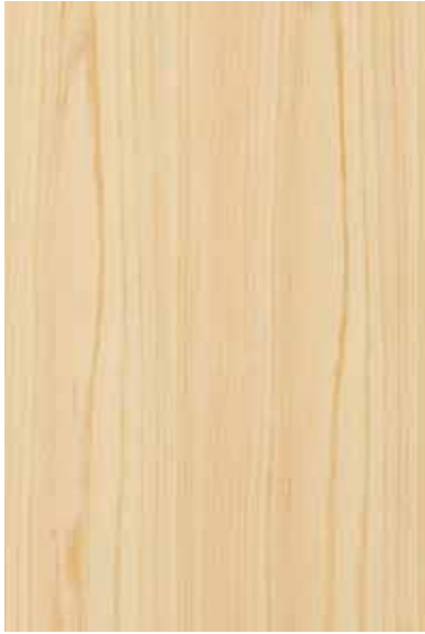
【大和】 桧 板目パターン Emma-WS-01 Y3