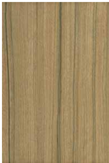
レオ 柀目ランダム Emma-GK-22 3