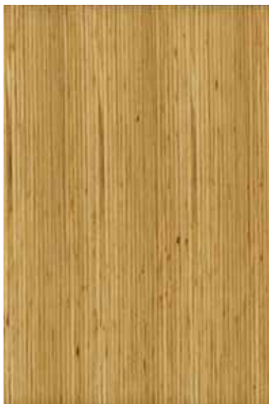
【杉】 LVL Emma-WM-99