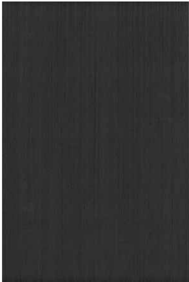
ブラックウェンジ 柀目ランダム Emma-RC-04 2