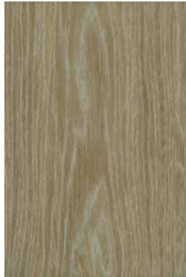
シルバーアプリコット 柀目ランダム Emma-RC-07 3