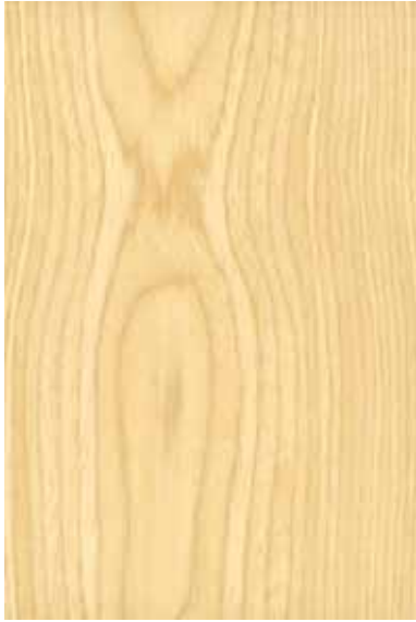
Wアッシュ 柀目ランダム Emma-RC-01 2