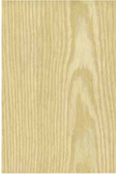
Wオーク 柀目ランダム Emma-RC-01 2