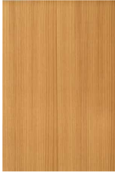
【天竜】 杉赤身 柀目パターン ※ 受注生産品