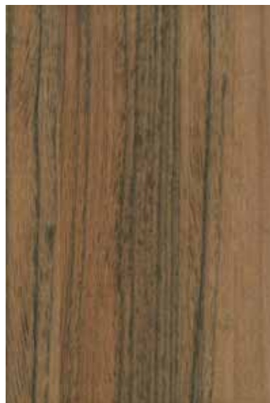
レッドレオ 柀目ランダム Emma-GK-23 3