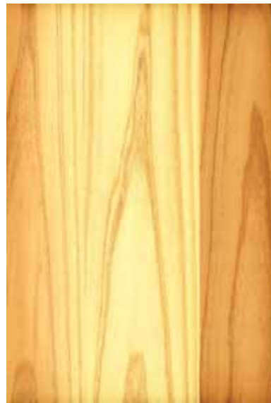
【みよし】 杉 板目ランダム Emma-WS-08 1

※ Emmaは天然木を使用した商品です。サンプルと実際の商品とは、木目柄、色味、濃淡、節等の入り方が異なります。