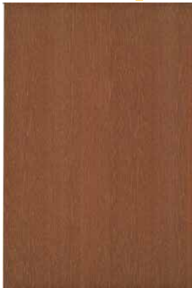
マコレ 柾目ランダム Emma-GK-10 2