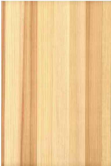
【大和】 杉源平 柀目ランダム Emma-WS-06V Y1