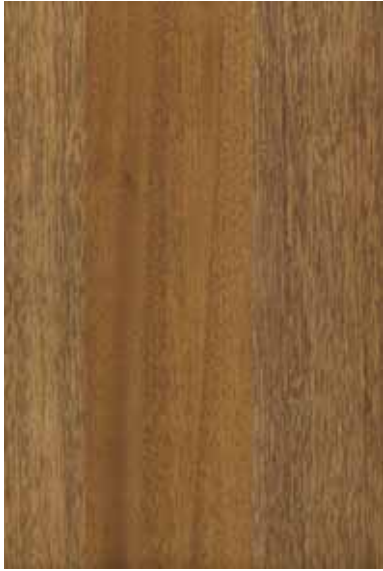
サペリ 柾目ランダム Emma-GK-01 2