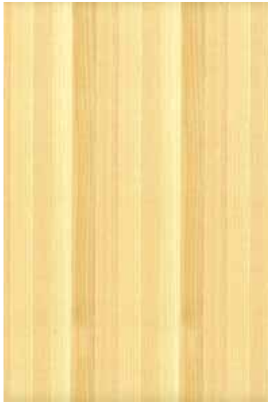
【東京の木】 桧 柀目ランダム ※ 受注生産品