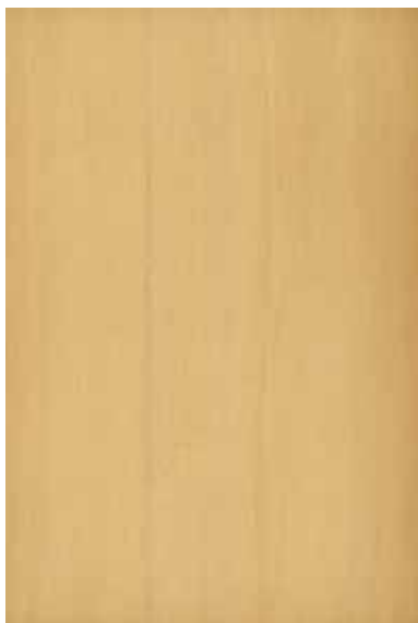
柀 柀目ランダム Emma-GK-17 3