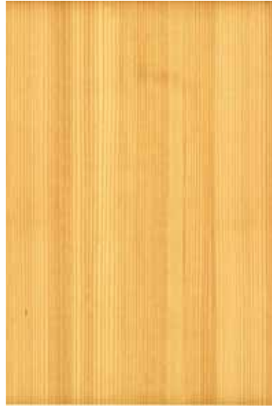
【大和】 杉赤身 柀目パターン Emma-WS-05V Y3