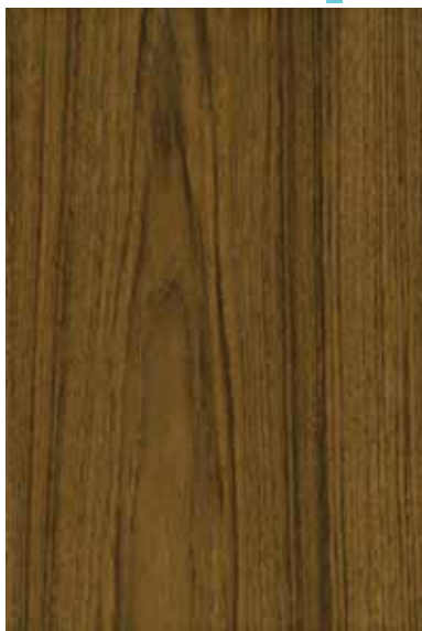
チーク 板目ランダム Emma-GK-18 4