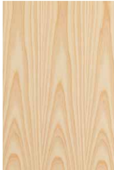
【大和】 杉白太 板目ランダム Emma-WS-09W Y2