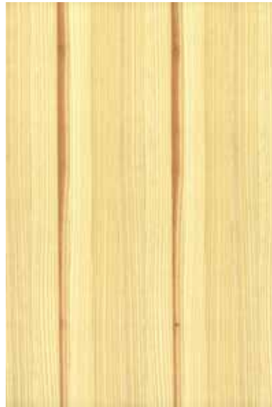
【東京の木】 杉 柀目ランダム ※ 受注生産品