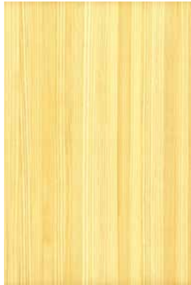
【大和】 杉白太 柀目ランダム Emma-WS-09V Y2