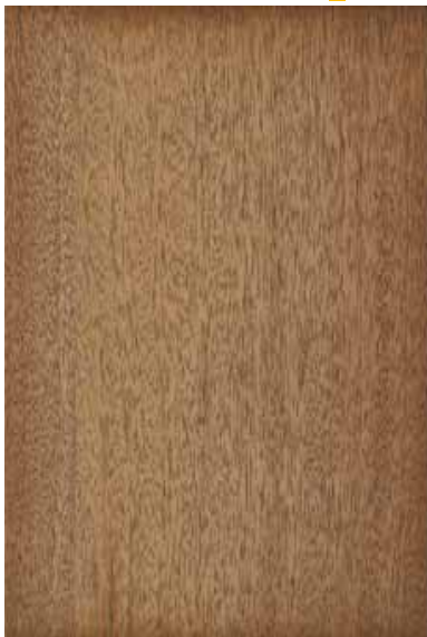
マホガニー 柾目ランダム Emma-GK-09 2