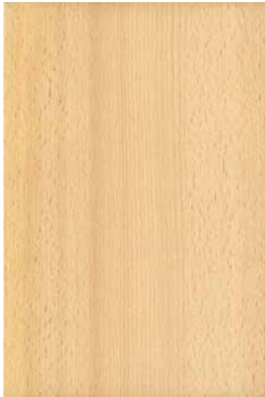
ブナ 柾目ランダム Emma-GK-06 2