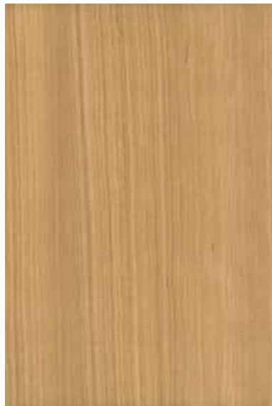
アメリカンチェリー 柀目ランダム Emma-GK-16 3