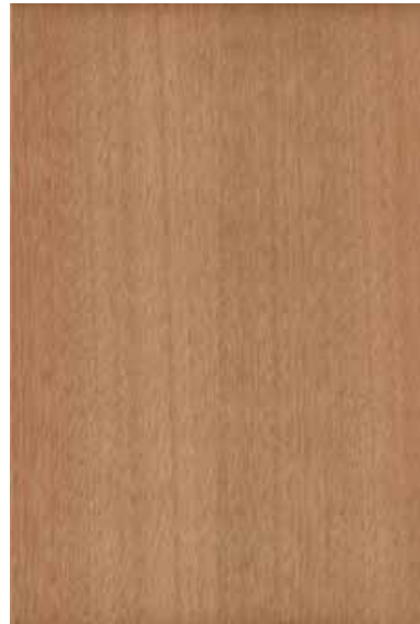
ニヤト 柾目ランダム Emma-GK-08 2