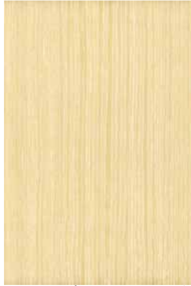
ホワイトアプリコット 柀目ランダム Emma-RC-03 2