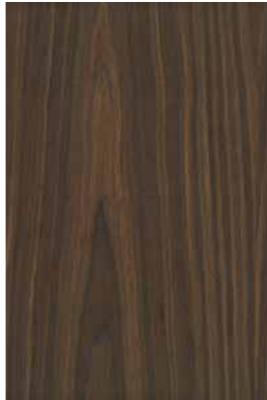
ローズウッド 柀目ランダム Emma-RC-06 3