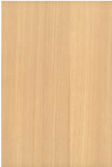
シルバーハート 柾目ランダム Emma-GK-05 2